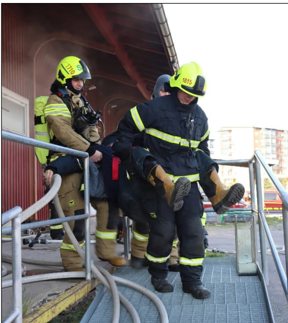
Turun, Kaarinan ja Maarian VPK:t harjoittelevat säännöllisesti myös yhdessä. Kuva huhtikuun yhteisestä rakennuspaloharjoituksesta.