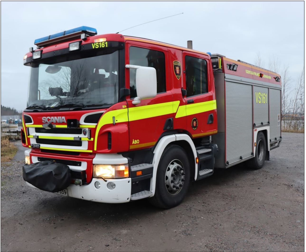
Loppuvuodesta 2026 Turun VPK:ssa käyttöön otettu uusi sammutusauto VS161 on ollut aiemmin Piikkiön VPK:n käytössä. Vuosimallia 2005 oleva ajoneuvo on iästään huolimatta erinomaisessa kunnossa.