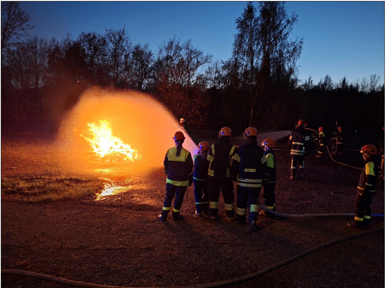
Nuoriso-osastolle järjestettiin keväällä 24 tunnin harjoitus, jonka aikana harjoiteltiin palokunnan perustehtäviä ja päästiin sammuttamaan myös oikeita harjoitustulipaloja.

Porin toiminta-alue järjesti yhteistyössä LSPel:in kanssa talvipäivän Nakkilassa 2.2.2025. Tapahtumassa oli mahdollista laskeutella, pulkkailla ja socialisoitua muiden palokuntien nuorten kanssa. Virkistäytymiseen osallistui osastostamme 10 nuorta ja 6 kouluttajaa.