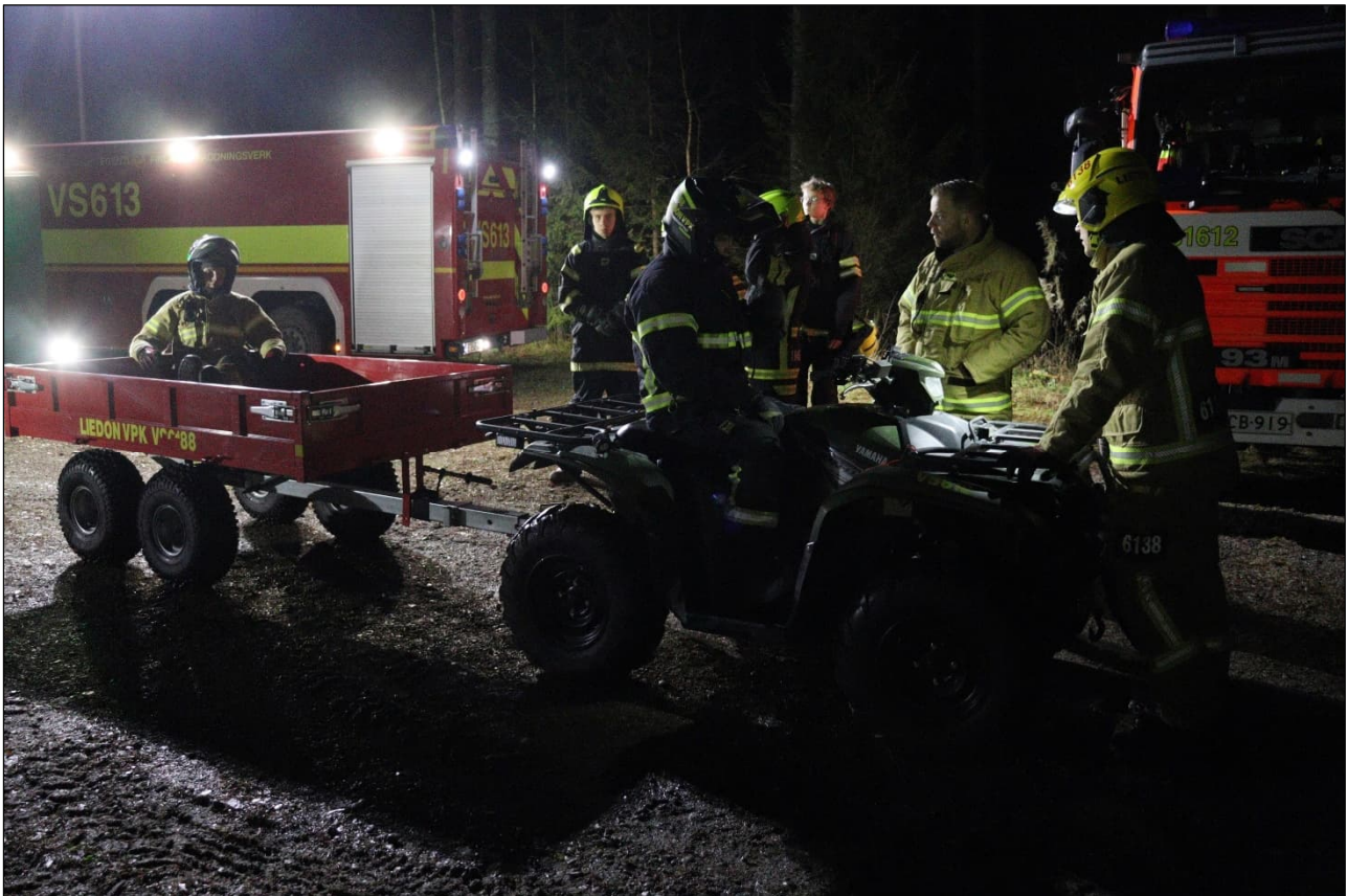
Liedon VPK järjesti hälytysosastolle mönkijäajokoulutusta marraskuun puolivälissä.

Harjoittelijoille järjestettiin vuoden aikana perehdytyskoulutusta hälytysosaston jäsenten toimesta.