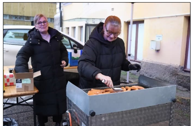
Turvallisuusviestintätapahtumat yhdistävät palokunnan osastoja. Kuvissa 14.12. järjestetyn VPK-päivän toteuttajia.