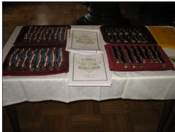
Jäsenillassa jaettiin hopeiset ja pronssiset Erik Julin ansiomitalit.