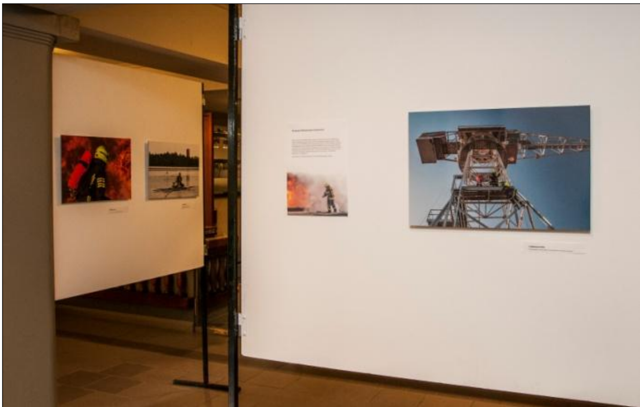
Elina Helkalan valokuvanäyttely alakerran vaateaulassa.