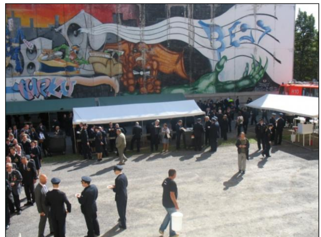
Kenttälounas VPK:n talon pihalla