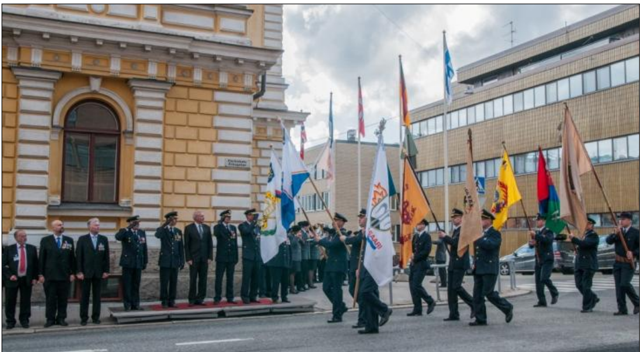
Paraatin vastaanotto VPK:n talon edustalla.