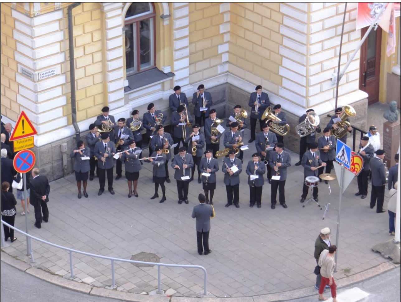
Puhallinorkesteri valmistautuu Palokuntaparaatin vastaanottamiseen VPK:n talon kulmalla.

Kahvikonsertin jälkeen oli vuorossa "konkarikaronkka" johon oli kutsuttu mukaan orkesterin vanhat soittajat ympäri Suomea sekä tietenkin nykyiset aktiivit. Karonkka päättyi 18.3. yhteiseen päiväristeilyyn.