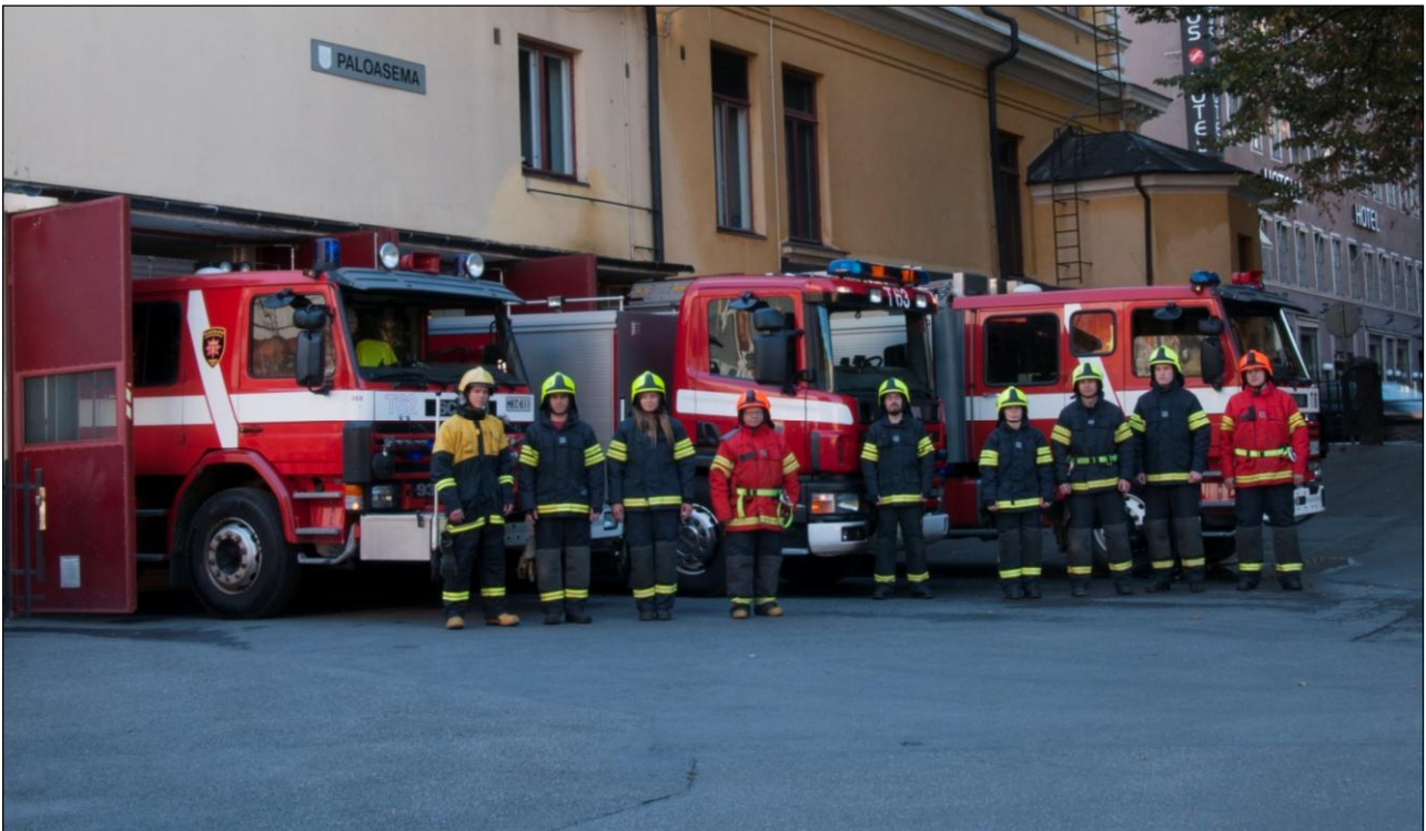
Hälytysosaston jäsenistöä ja raskasta ajoneuvokalustoa paloaseman edustalla.

Varainhankintaa suoritettiin osallistumalla mm. palovartiointiin ja antamalla turvallisuus-koulutusta.