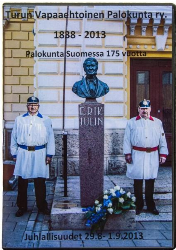
DVD-tallenne 1 h 6 min. Tuotanto: Niko Kostet. Käsikirjoitus: Lars Wirén.

Useiden selvitysten ja useiden kielteisten avustusanomusten jälkeen päätettiin palkata Niko Kostet ryhmineen videoimaan juhlaiviikonlopun tapahtumat. Kuvaussopimuksen hinta oli 3000 euroa. Sopimus sisälsi kuvauksen, editoinnin sekä 100 kpl noin tunnin DVD-tallenteen kopioimisen ja luovuttamisen tilaajalle. Kuvausryhmä ja Lars Wirén tekivät töitä koko syksyn 2013 ajan filmin valmistumiseksi. Lars Wirén käytti työskentelyyn runsaat 100 tuntia. Vuorovaikutus tapahtui sähköpostitse. Käsikirjoitus ja sen siirtäminen tallenteeseen hoidettiin siten, että leikkaaja, äänittäjä, tekstittäjä tekivät osuutensa yksitellen. Vuoden 2013 lopulla DVD-tallenne ei ollut valmistunut. Päätös kuitenkin tehtiin siitä, että jos ja kun tallenne vuoden 2014 alkupuoliskolla valmistuu, sitä myydään 25 euron hintaan Turun VPK:n jäsenille ja halukkaille ulkopuolisille tahoille.