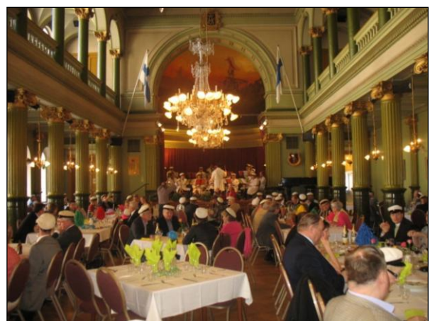
Puhallinorkesterin vappulounas 1.5.2013.