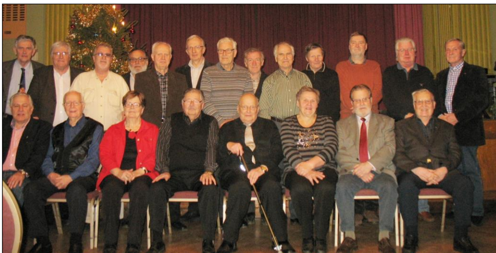
Veteraaniosasto yhteiskuvassa joulun alla 2013.

Tanssitilaisuuksien järjestyksen valvontaan ja ravintolatyöskentelyyn veteraanit ovat osallistuneet viisi kertaa toimintavuoden aikana. Veteraanit osoittivat esimerkillään erinomaista yhteistyötä yhdistyksen jäsenten keskuudessa. Veteraanien edustajat vaalivat juhlien aikana pukeutumisperinteitä useiden tilaisuuksien yhteydessä. Joulukuussa järjestettyjen neljän myyjäistapahtuman järjestelyissä veteraanien panos oli merkittävä. Myyjäispöytien ja kaluston siirtotyöt, järjestyksen valvonta, lipunmyynti ja myyntipaikkojen vuokraus olivat veteraanien vastuulla.